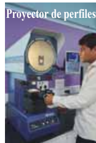
Proyector de perfiles