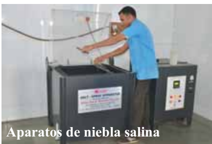
Aparatos de niebla salina