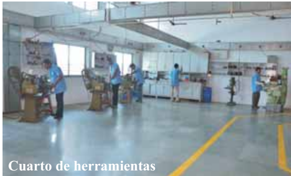
Cuarto de herramientas