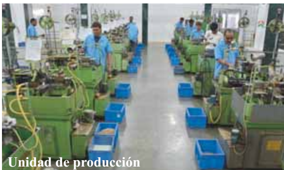
Unidad de producción