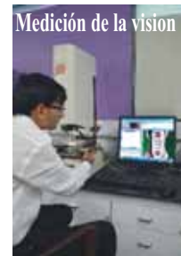
Medición de la visión