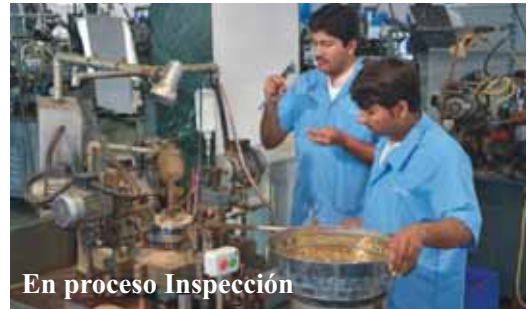
En proceso Inspección