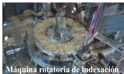
Máquina rotatoria de indexación

Balark tiene más de 450 máquinas diferentes para las actividades de producción y actividades cuarto de herramientas. Balark ha dedicado y departamento separado para el mantenimiento de la máquina y otras tareas de mantenimiento periódico. Además de las tener una fuerza de fabricación comprensiva, Balark también tiene un departamento separado para el diseño y desarrollo de nuevos productos.