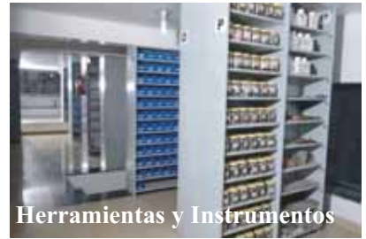
Herramientas y Instrumentos

Balark tiene sistema totalmente informatizado para el control y el monitor almacenamiento, manipulación, preservación y el flujo de interior - exterior de material. El sistema se asegura de que el flujo ininterrumpido de todos los insumos necesarios como herramientas, equipos, materiales y menpower en cada etapa del proceso. El sistema bloquea el movimiento adicional de material sin inspeccionar, en cada proceso.