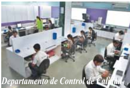
Departamento de Control de Calidad