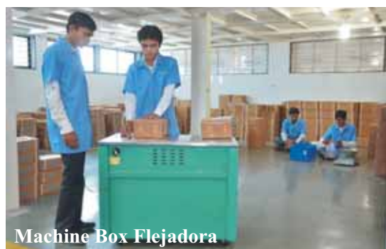
Machine Box Flejadora

Balark ha desarrollado sistema totalmente informatizado para el embalaje. El sistema permite la selección de solamente, material de calidad aprobado para el embalaje, generar un número de código único para cada caja o bolsa para llevar. Sólo número de código único es necesario para rastrear el material para no sólo sus procesos, pero hasta el nivel de proveedor, de los cuales, que adquirió la materia prima.