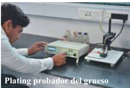
Plating probador del grueso