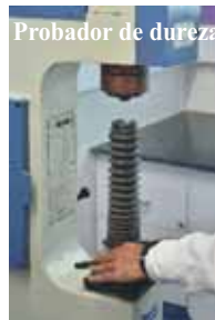
Probador de dureza