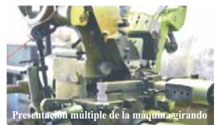
Presentación múltiple de la máquina girando