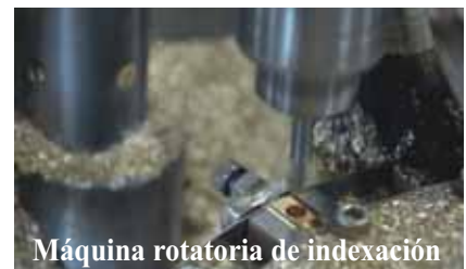
Máquina rotatoria de indexación