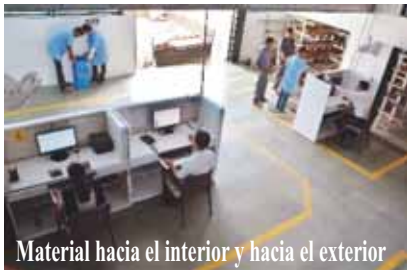
Material hacia el interior y hacia el exterior