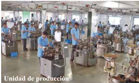
Unidad de producción